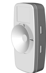
Achterkant met zuignap